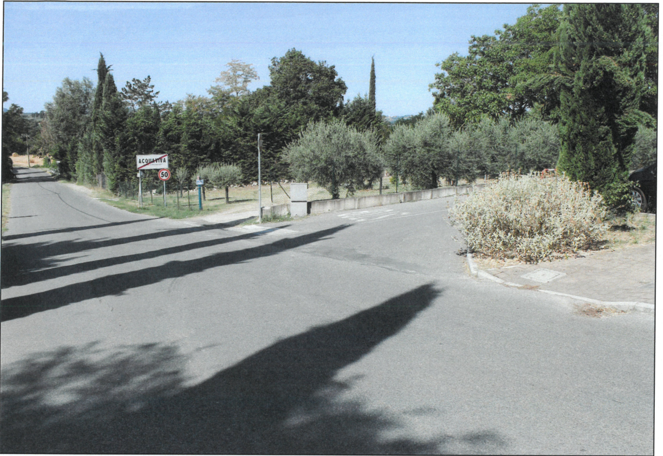
1 - VIA DELLE VECCHIE MURA