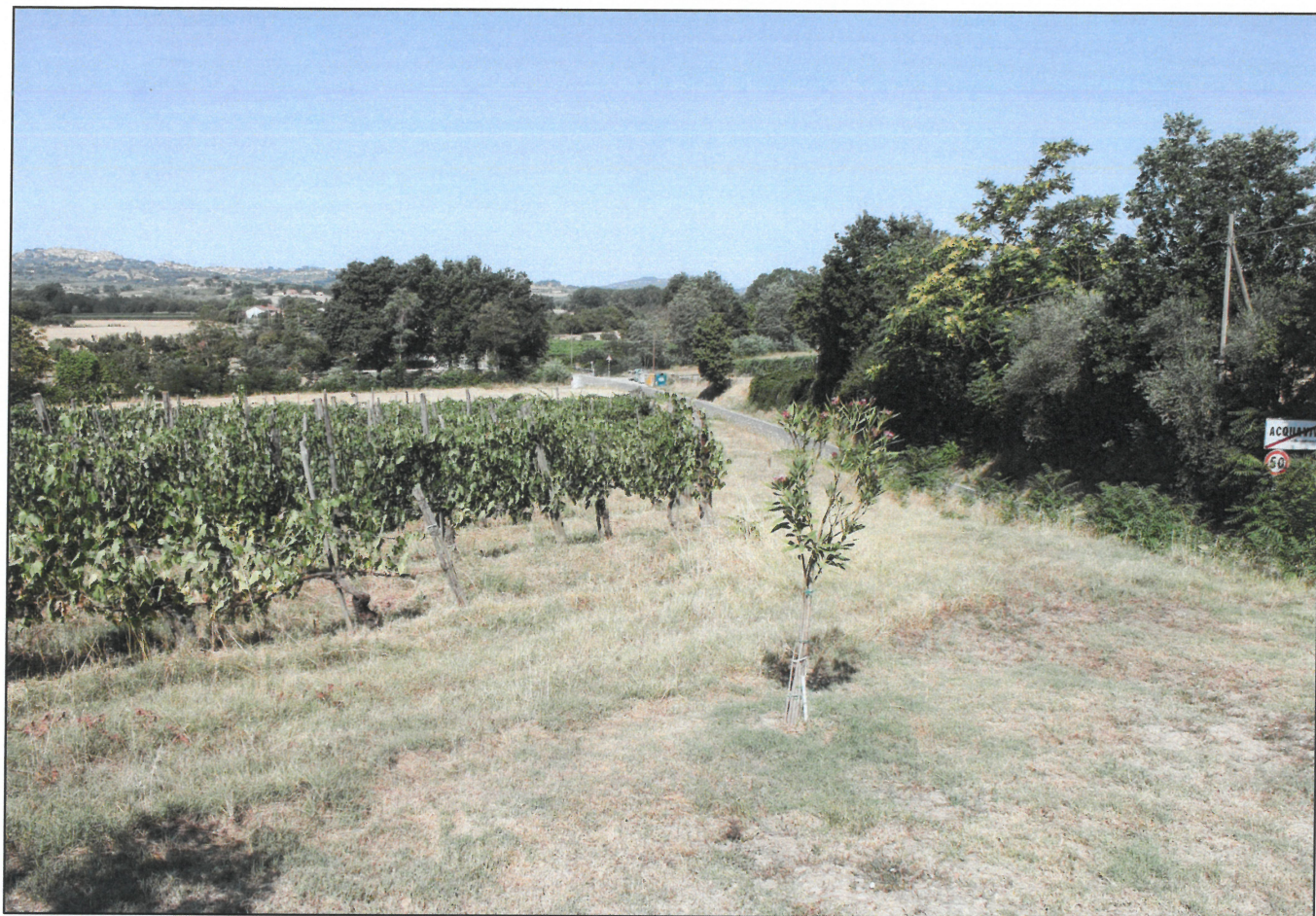
3 - AREA D'INTERVENTO