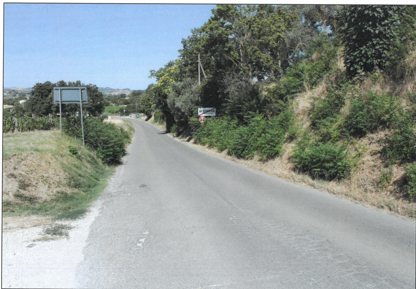
4 - VIA DEL TOMBINO