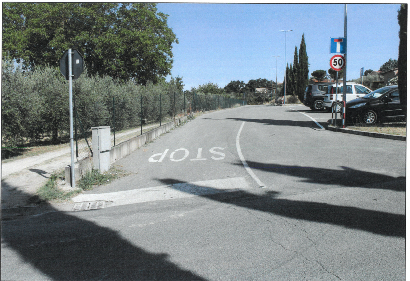
2 - STRADA DI LOTTAZIONE