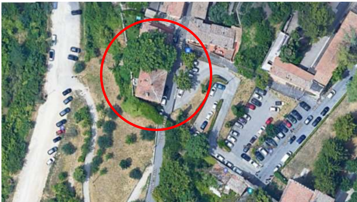
IMMAGINE 3 – Foto aerea.-