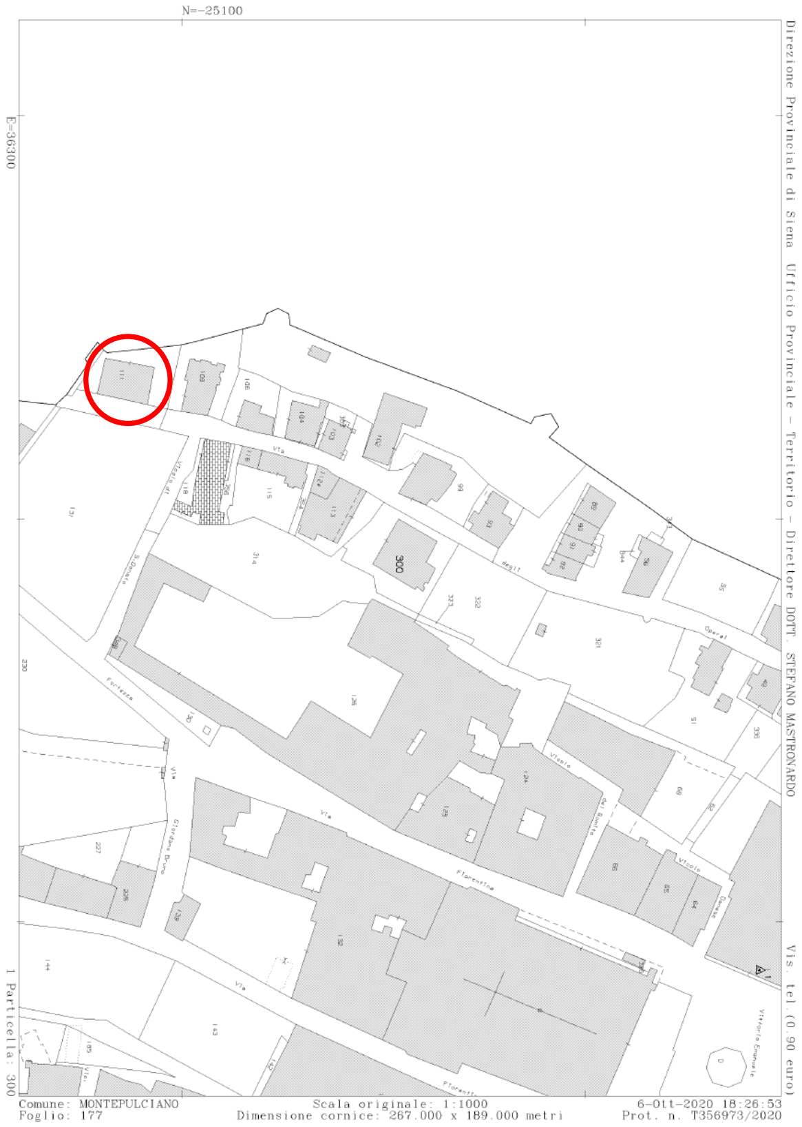
IMMAGINE 2 – Mappa Catastale.-