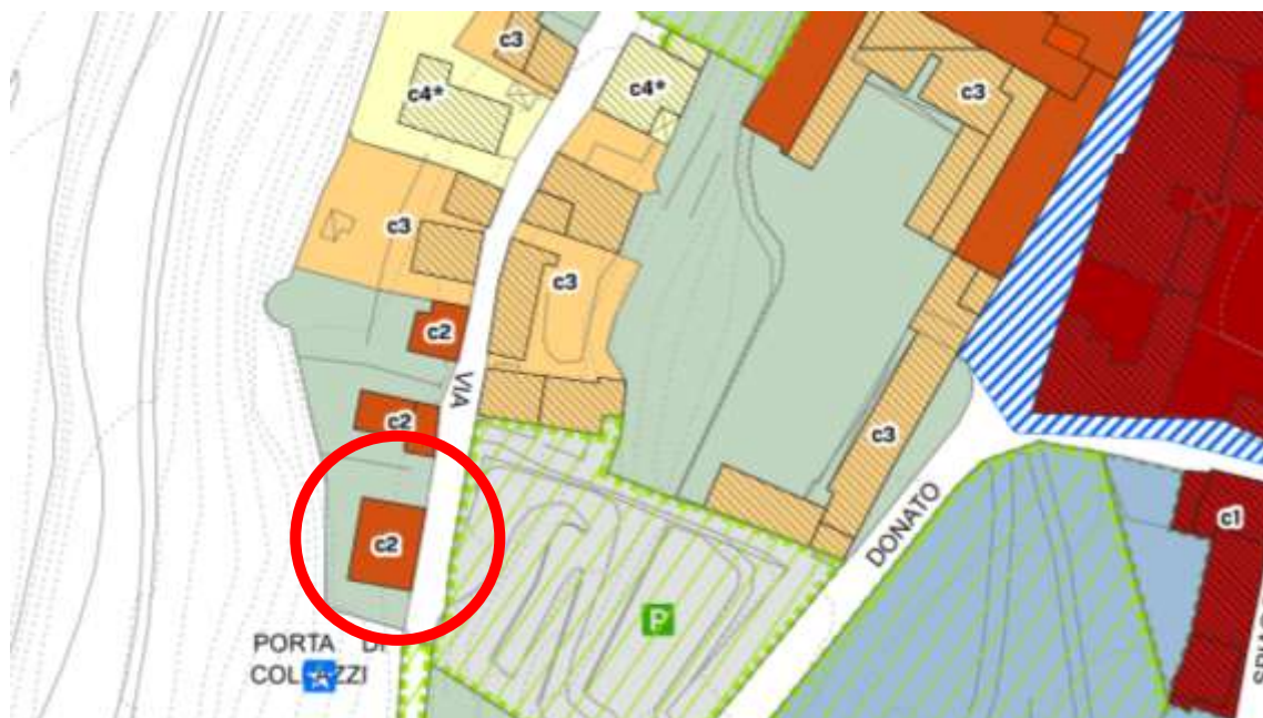
IMMAGINE 4 – Piano Operativo.-