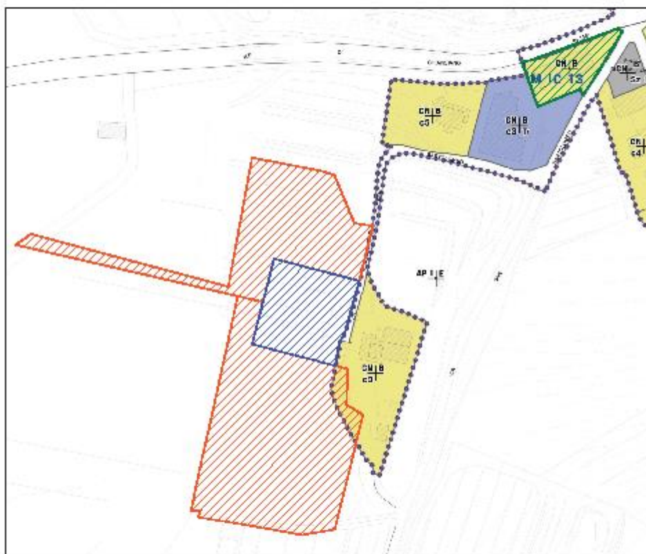
STRALCIO DI PIANO OPERATIVO SCALA 1:2000