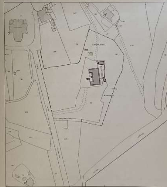
ESTRATTO DI MAPPA CATASTO TERRENI Foglio n. 116, P.lle n. 35, 157, 37, 171 Scala 1:2.000