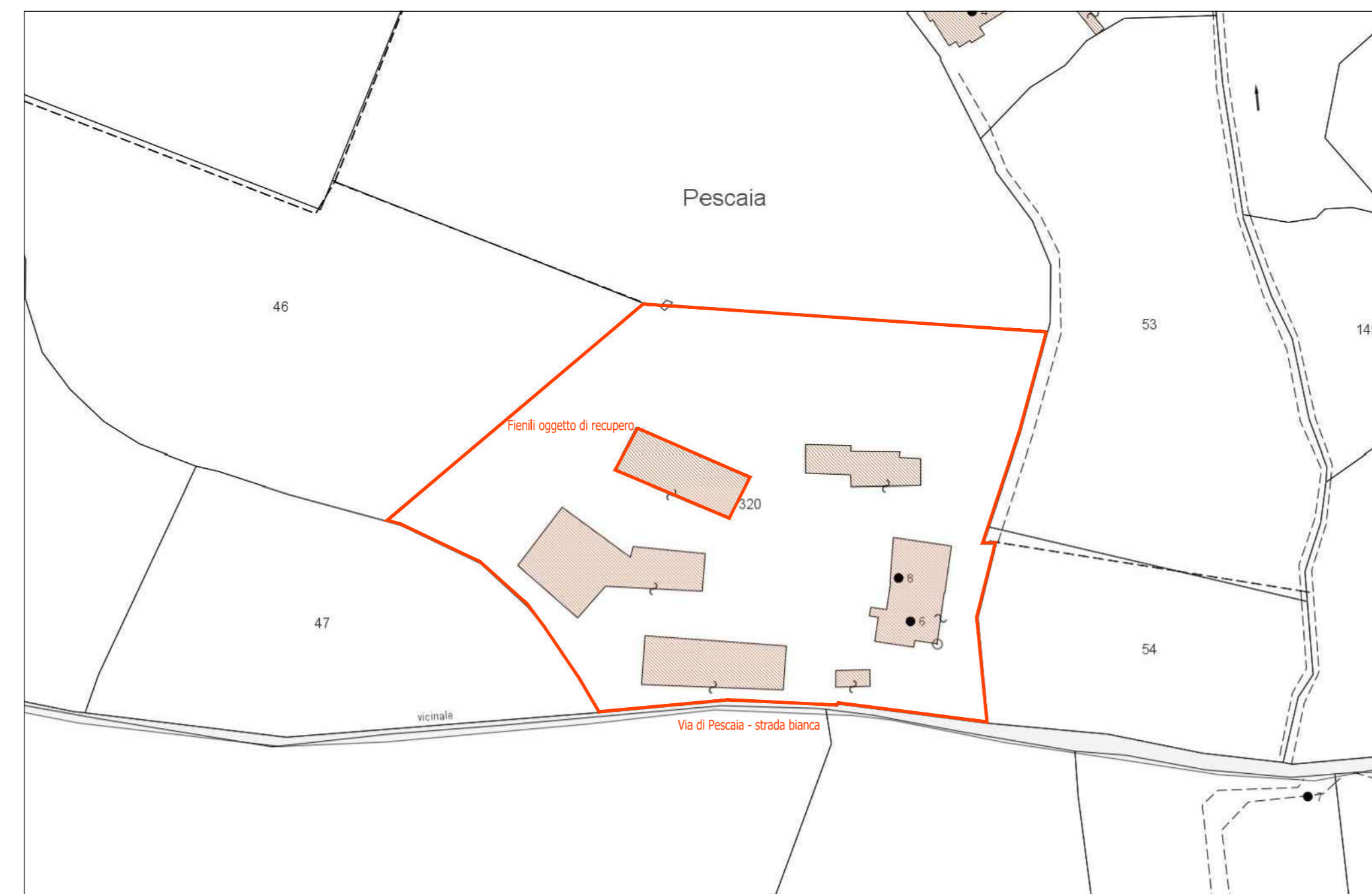
Inquadramento catastale - scala 1:1000