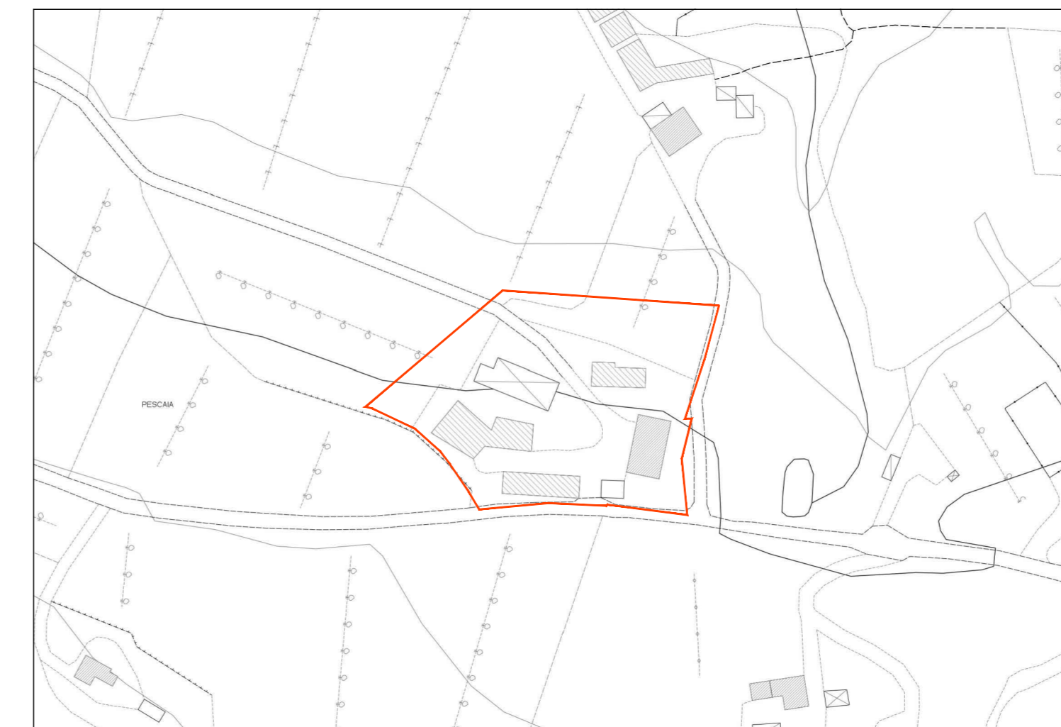
Ctr - scala 1:2000