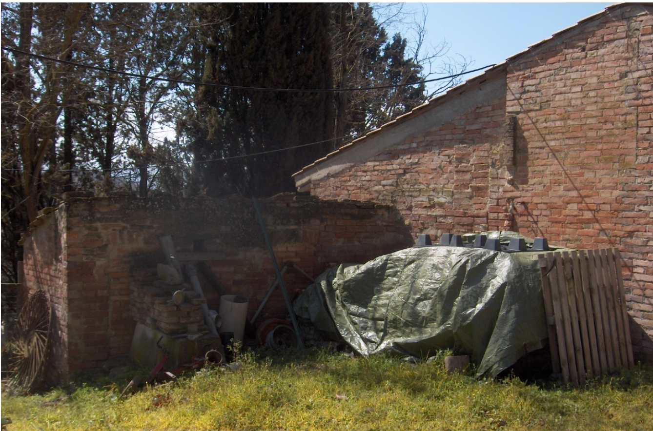
PARTICOLARE LATO EST CORPI IN ADERENZA