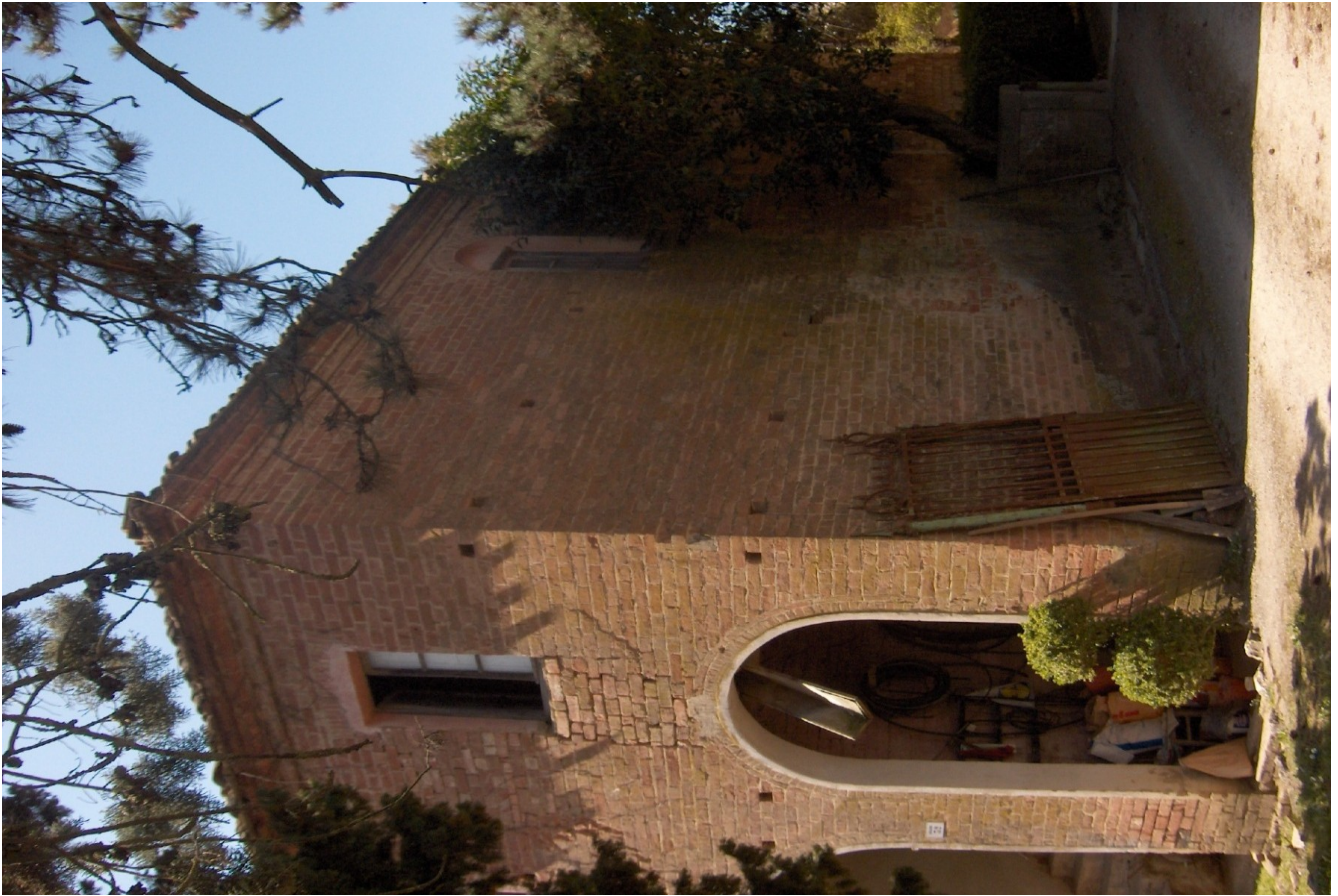
PROSPETTO LATI EST E NORD