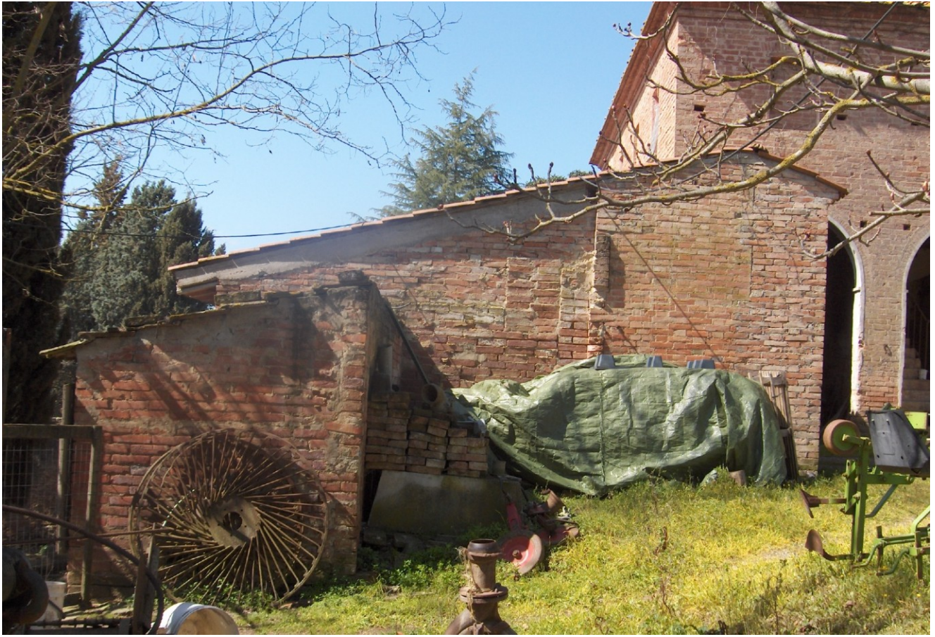
PROSPETTO LATO EST