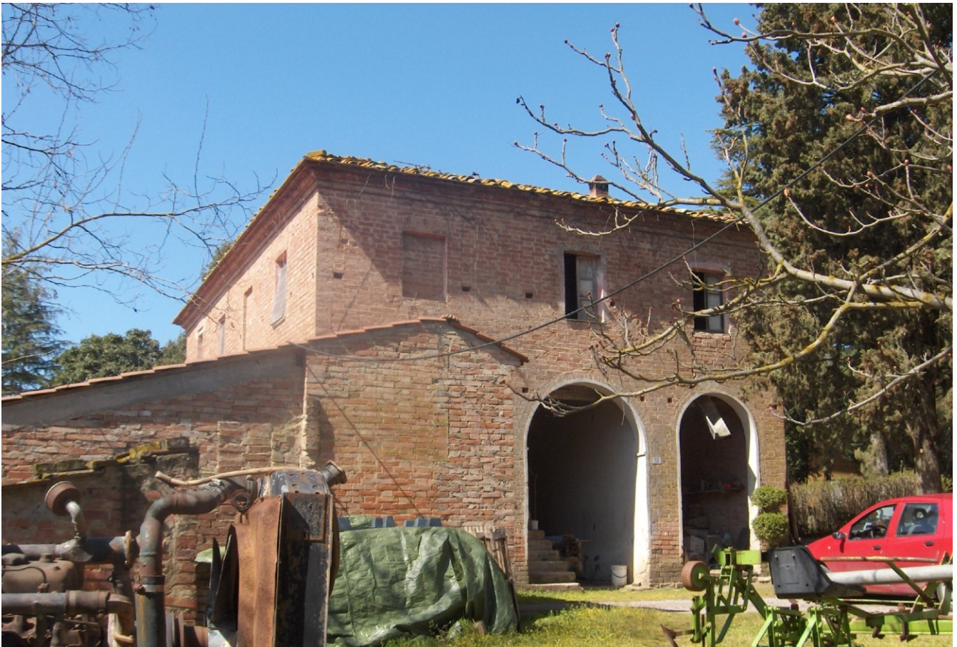
PROSPETTO LATO EST