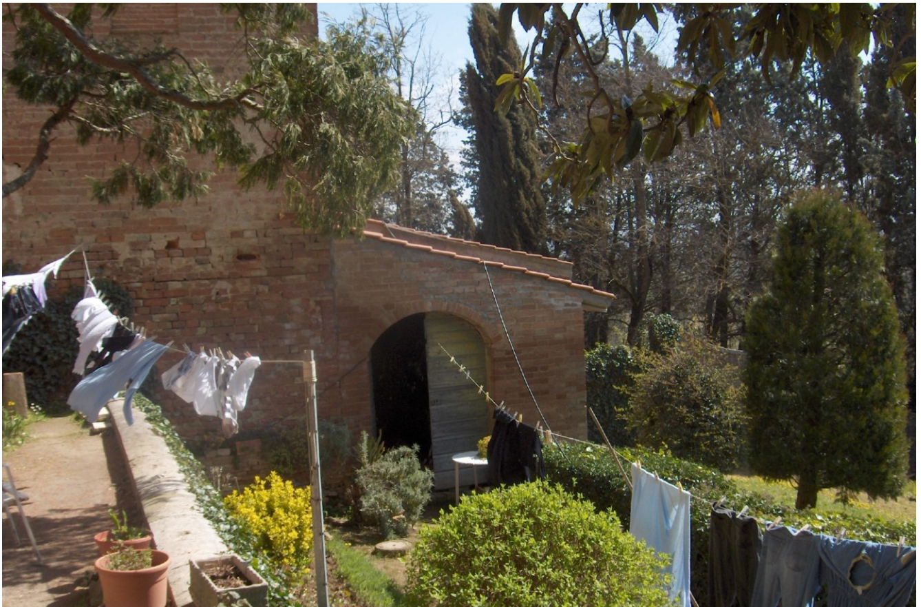
PROSPETTO LATO OVEST