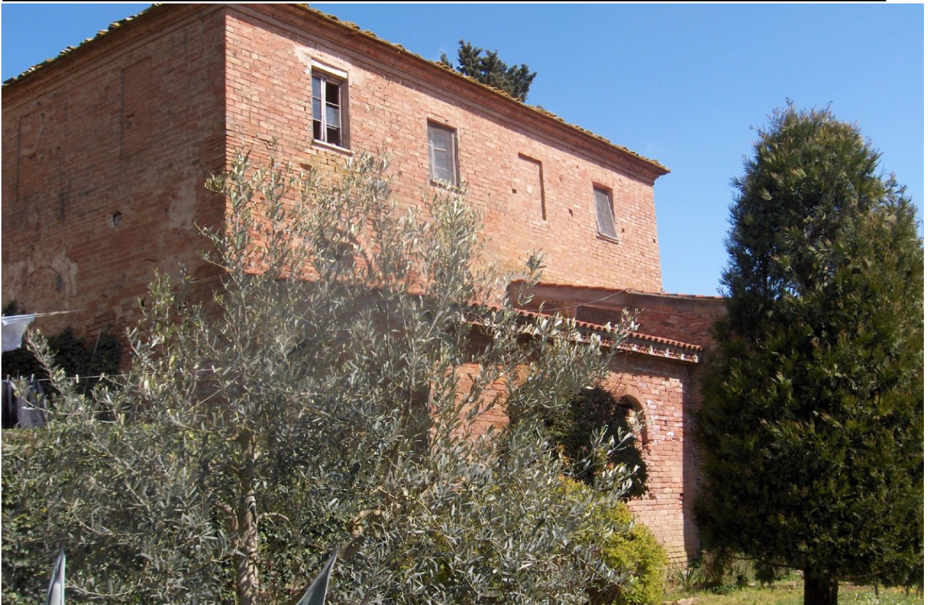
PROSPETTO LATO SUD