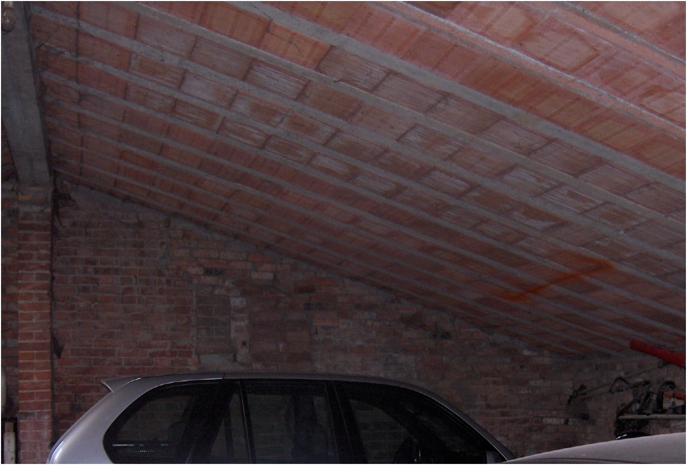
INTERNO DI UNO DEI CORPI IN ADERENZA