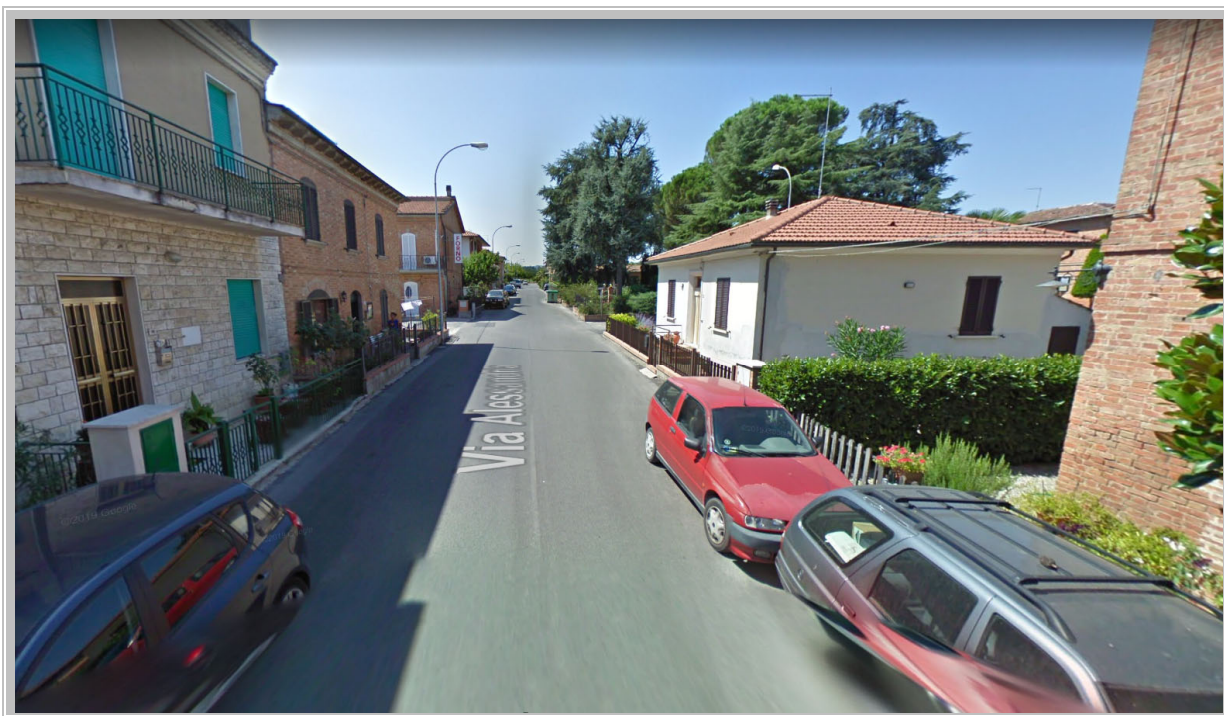
Foto 9 – Via Alessandria (erroneamente indicata come percorso del fosso tombato)

Il tecnico incaricato (Geom. Luigi Rocchi)