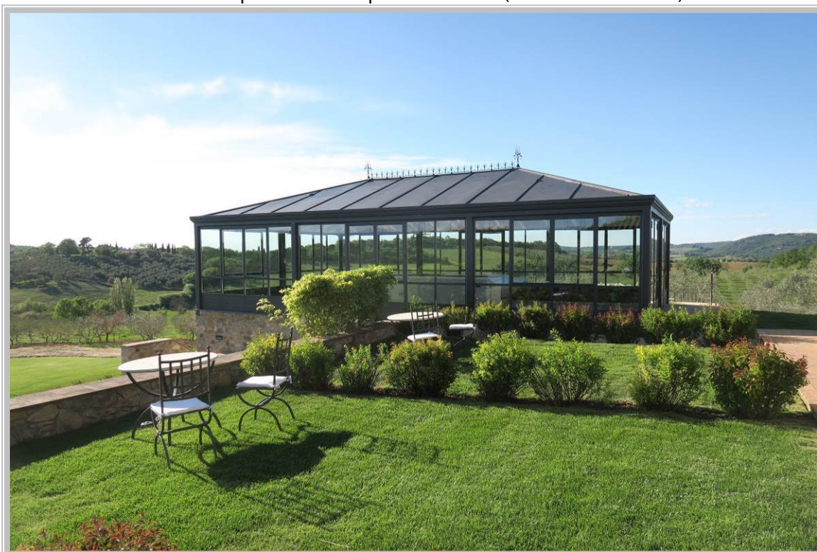
Foto 6 – Fabbricato facente parte del complesso edilizio (Indicato con il n. 4)