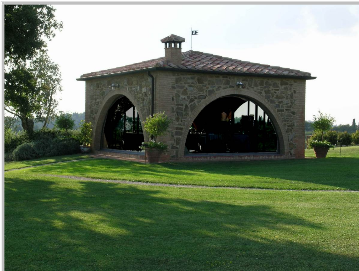
Foto 5 – Fabbricato facente parte del complesso edilizio (Indicato con il n. 3)