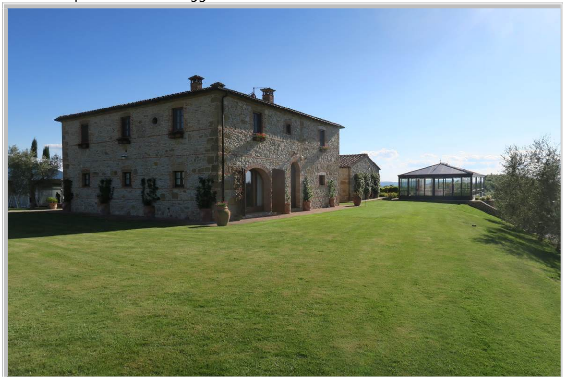
Foto 2 – Complesso Edilizio in oggetto (Fabbricati indicati con i n. 1, 2 e 4)