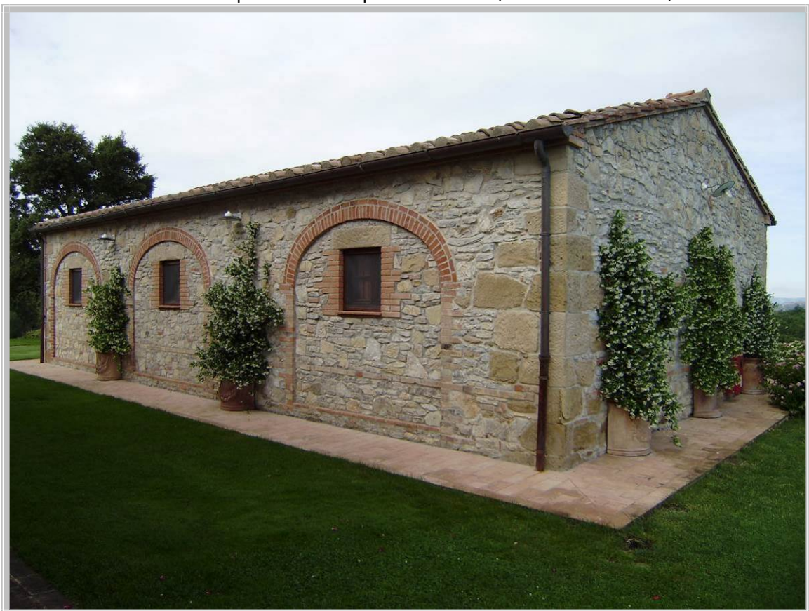
Foto 4 – Fabbricato facente parte del complesso edilizio (Indicato con il n. 2)