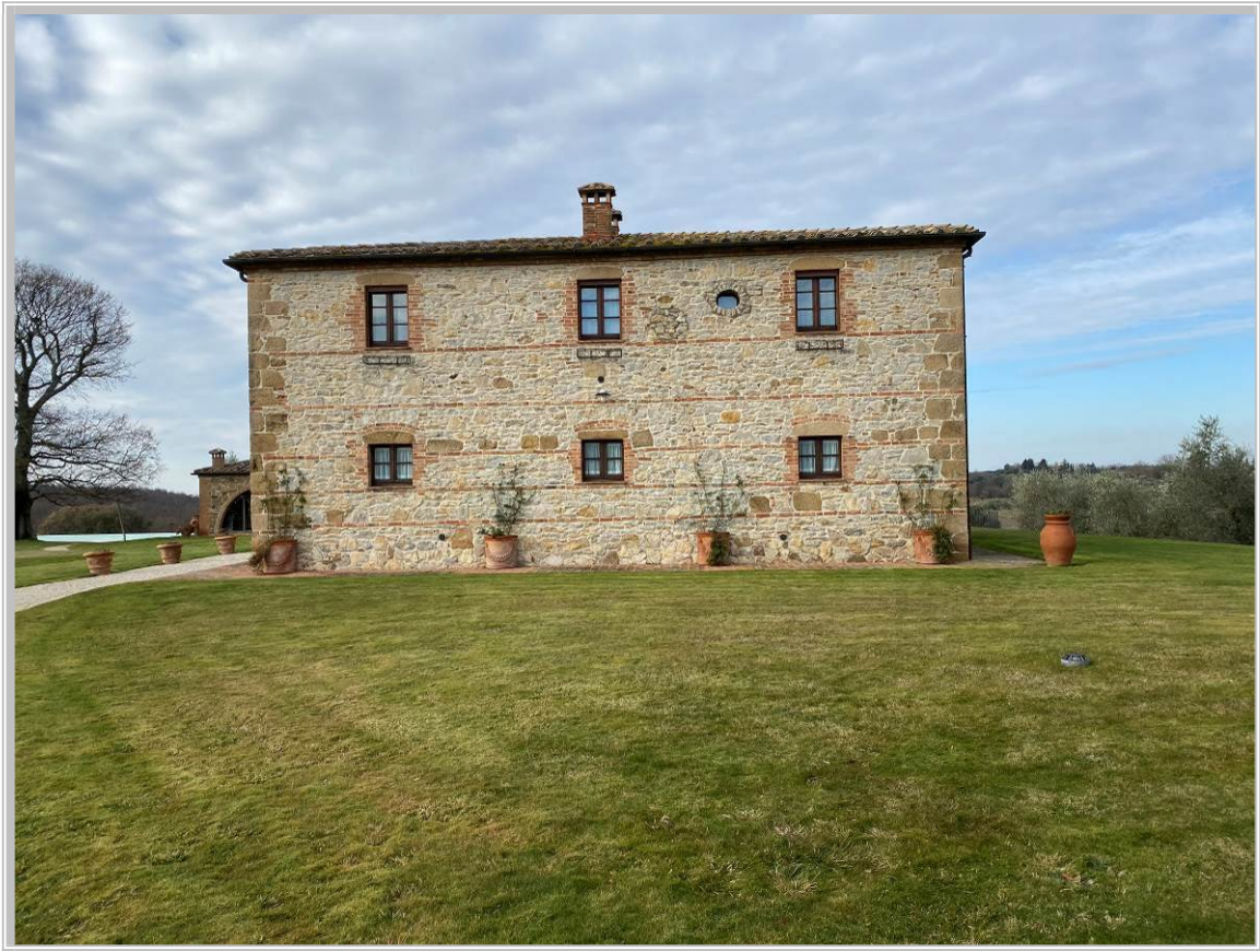
Foto 3 – Fabbricato facente parte del complesso edilizio (Indicato con il n. 1)